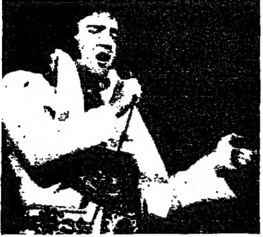
آخر صورة لريس بريسل